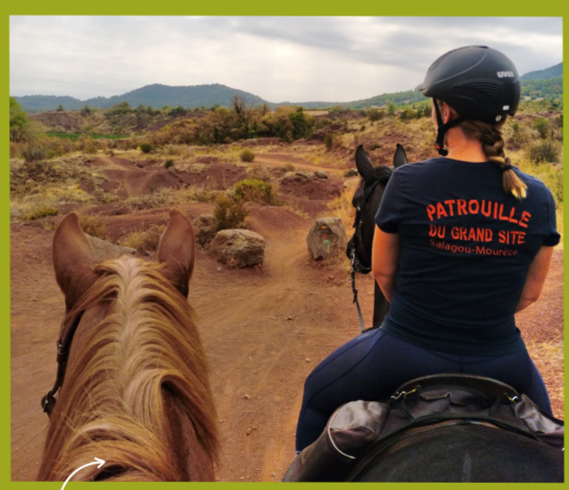
Des patrouilles sensibilisent pour préserver les paysages et la biodiversité.

Le Grand Site assure le suivi et protège 21 espèces d'oiseaux et 7 espèces de chauve-souris menacées à l'échelle européenne (Natura 2000). Des règles spécifiques s'appliquent pour ne pas perturber leurs habitats, notamment en période de reproduction. Grand-duc d'Europe, Blongios nain, Petit rhinolophe... ces animaux participent à la richesse du site.