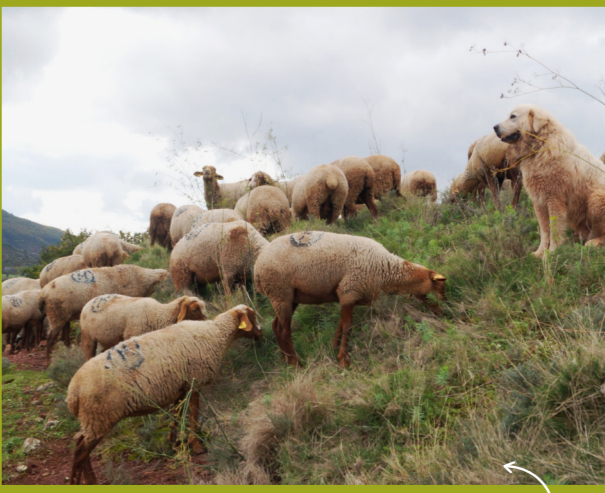
Le pastoralisme maintient les paysages ouverts, favorables à la biodiversité.