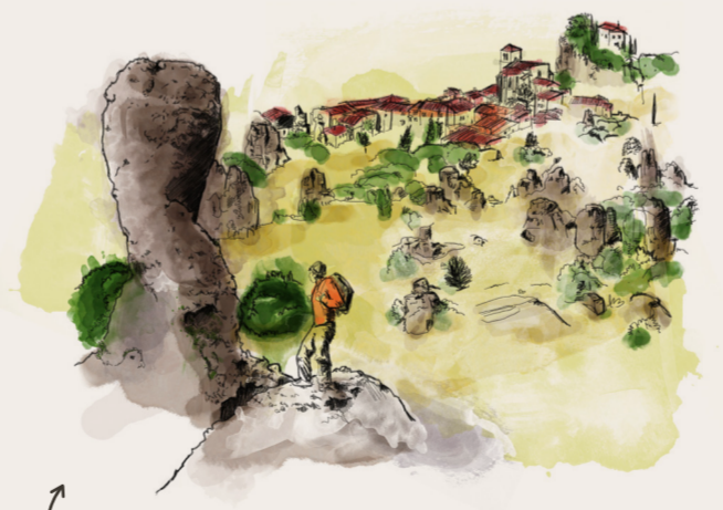
Gigantesque chaos dolomitique, le Cirque de Mourèze (165 millions d'années) est sculpté par l'érosion.

The Grand Site is marked by millions of years of history. It includes traces of pre-mammal species dating from 270 million years ago (Permian period). These ancestors of today's mammals appeared long before the dinosaurs!