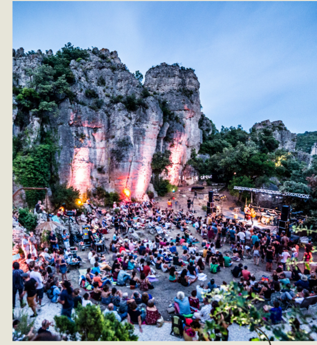
Les villages du Grand Site proposent des animations toute l'année.