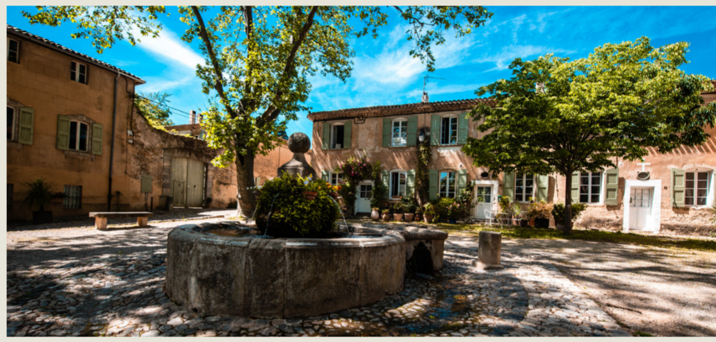
Villeneuve, ancienne cité drapière, devient manufacture royale sous Louis XV.